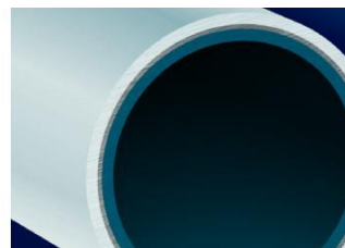
Uni Pipe PLUS